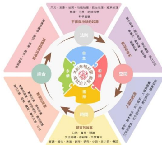
臺北市忠義實驗國民小學課程架構圖

本校採四學季課程安排，進行跨域混齡之沉浸學習。以蒙特梭利之宇宙教育課程(包含天文、物理、化學、地理、生物、歷史、語言、數學、藝術、人類學…)為核心，幫助孩子建立整體性的世界觀；另結合外出課(outing)、本土語文、英語文、健康與體育、資訊素養、動靜態社團選修等課程活動，深化學子善用學習工具，及提升學習策略之自主學習素養，接軌世界、邁向永續。