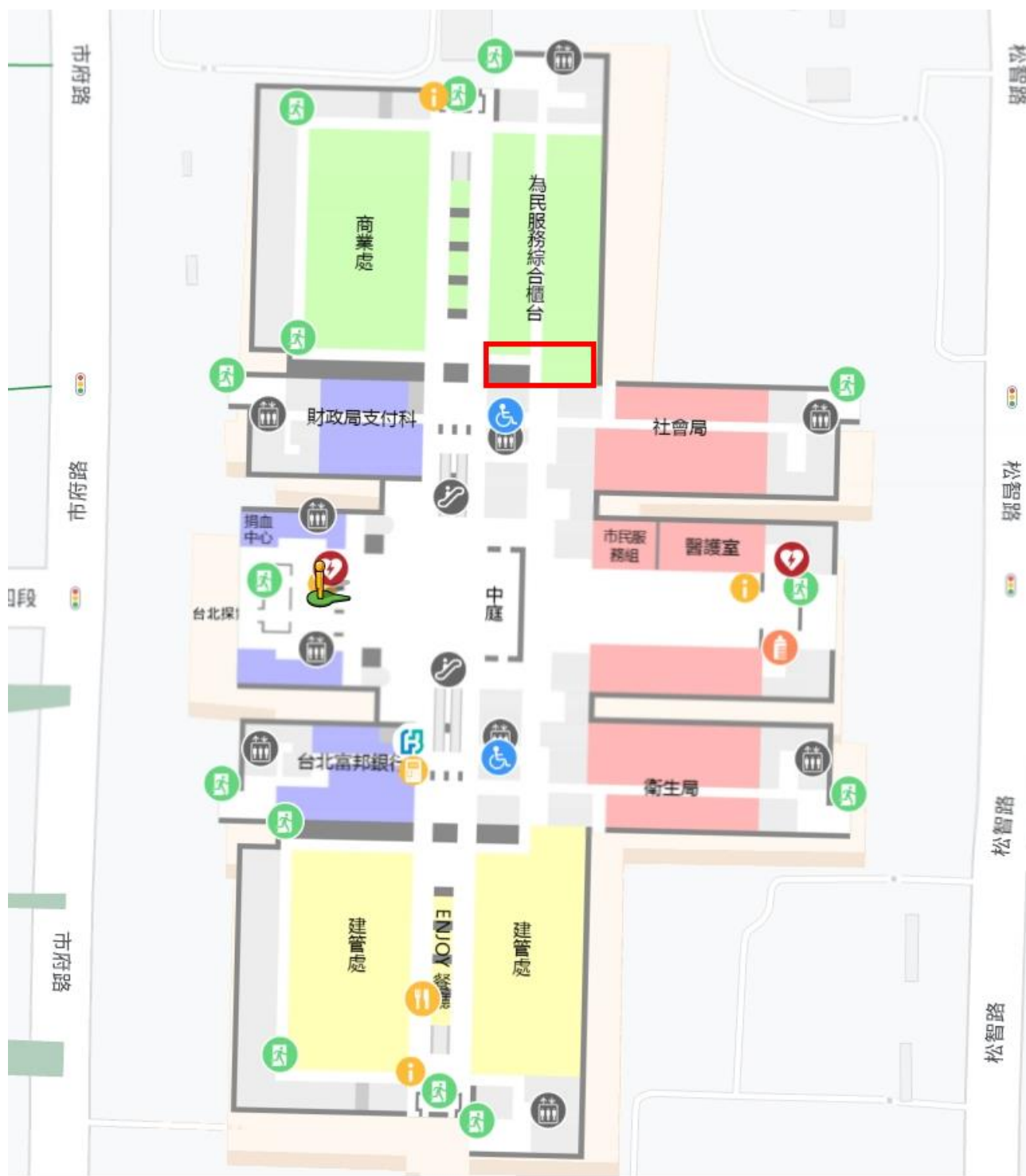
臺北市政府市政大樓1樓室內地圖